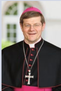
Stephan Burger Erzbischof der Erzdiözese Freiburg