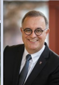
Dr. Gebhard Fürst Bischof der Diözese Rottenburg-Stuttgart